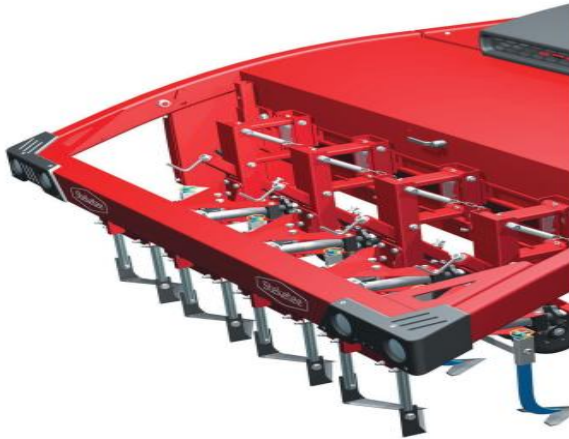
Billede 4. Steketee IC – In Row rensning.

Steketee arbejder på deres løsning på rensning i rækken kaldet IC-weeder. Denne maskine er i princippet en almindelig radrenser, hvor der er monteret to værktøjer, der svinger ind i rækken fra hver side. Se et YouTube via dette link .