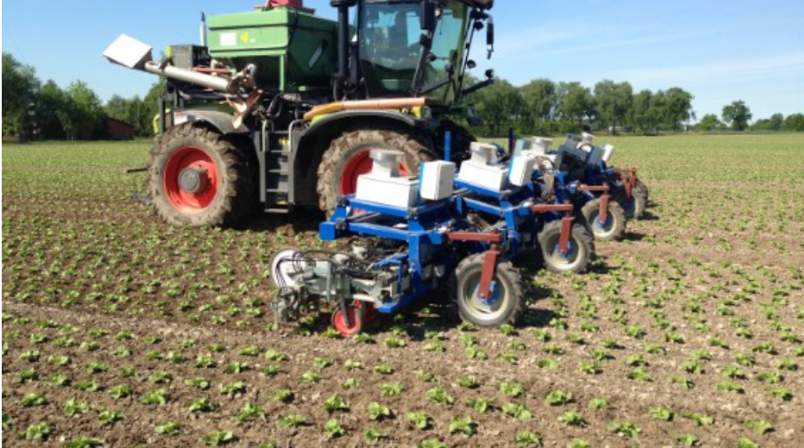
Billede 2. 12 meter Intra-Row Weeder.