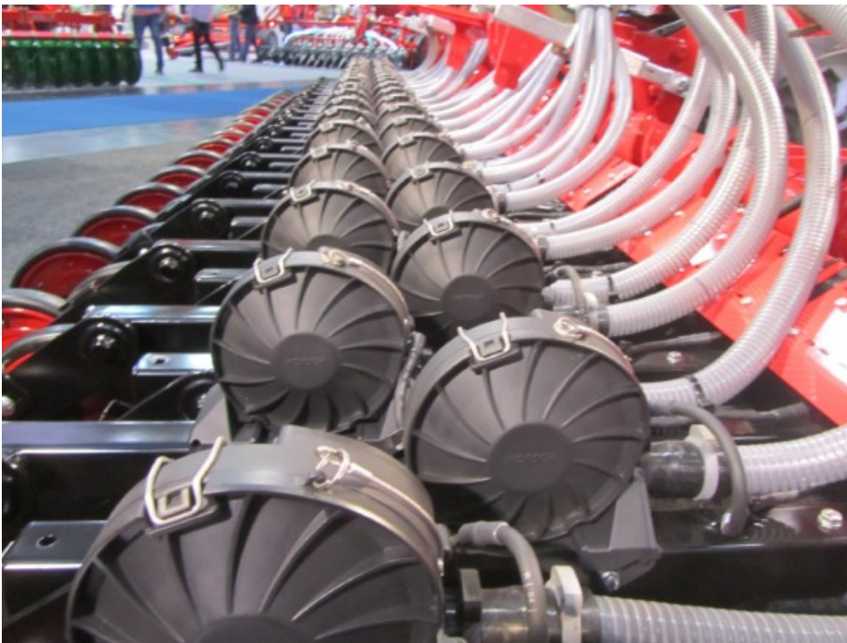
Billede 3. Enheden reducerer forskellen på afstanden mellem planterne.

Ved radrensning i rækken er ensartet såning essentiel. Både mellem rækkerne, som tidligere nævnt, men også mellem de enkelte kulturplanter. Enkeltkornssåning er en mulighed, men til såning af kornafgrøder er såmetoden dyr. Derfor arbejder maskinleverandørerne på andre og billigere muligheder. Horsch arbejder f.eks. på en enhed, der reducerer forskellene på afstandene mellem kulturplanterne ved radsåning.