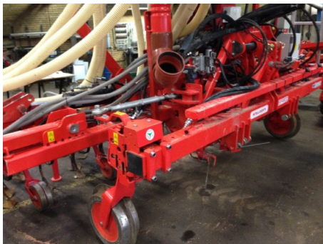
Billede 6. Gaspardo radrenser med rækkefølere

Derfor har Gaspardo udviklet en løsning til styring af radrenseren i relativt store majsplanter. Systemet består af to stykker rundjern, der via en switch styrer renseren i modsat retning af påvirkningen.