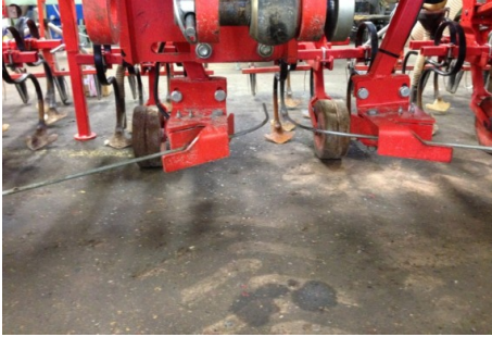
Billede 7. Følerne styrer radrenseren i forhold til rækken