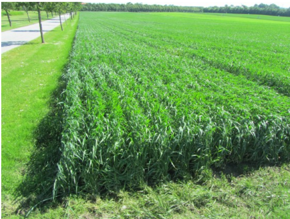
Billede 1. Det kan ikke umiddelbart ses, men rækkeafstanden i denne mark varierede mellem 18 og 25 cm.

Det bredere ubehandlede bånd vil alt andet lige medføre væsentligt mere ukrudt i marken.